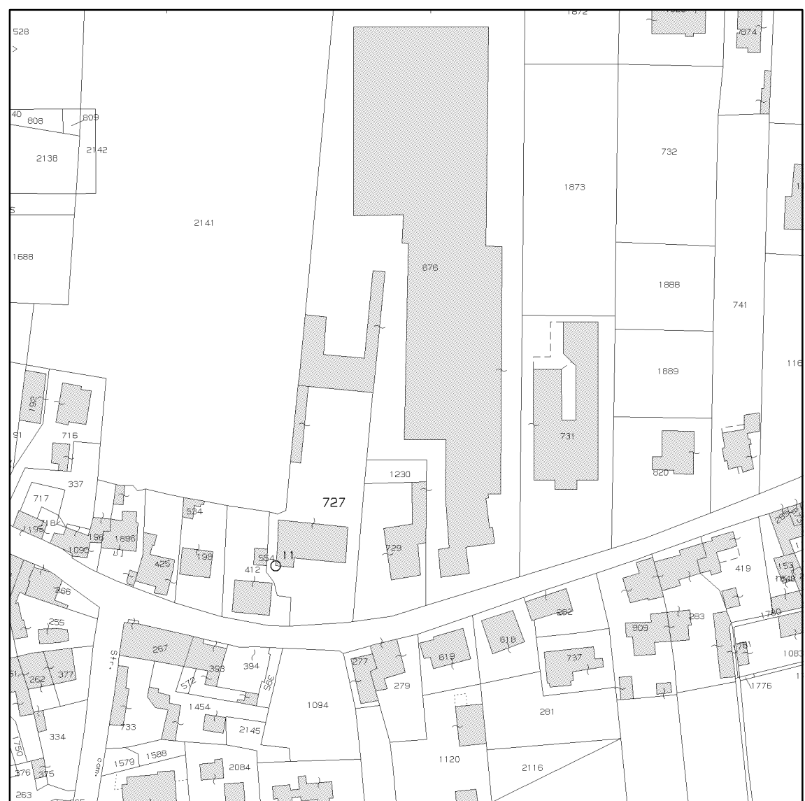
ESTRATTO MAPPA scala 1:2000 Foglio 2°, mappali 727-876